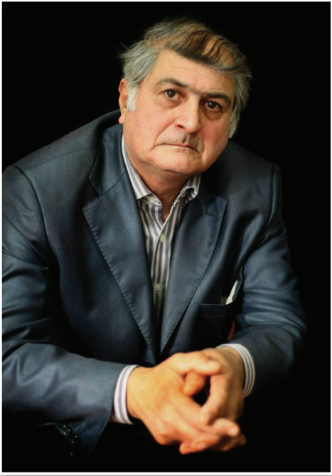
(əvvəli ötən sayda)

Qeronti Kikodze Şəmsədilli Əli Sultanın dar gündə II İraklinin hoyuna yetdiyini qeyd edərək yazır: “Kəlbəli xan özünün 4 minlik qoşunu ilə Jinvala yaxınlaşan vaxtlar Xevsuredən Tiflisə doğru üç yüz döyüşçü İrakliyə köməyə tələsirdi. Burada şəmsədillilərdən xevsurlar eşitdi ki, gürcü çarı Krtsanis yaxınlığında məğlub oldu, Tiflis Ağə Məhəmmədin əlinə keçdi. Elə bu söhbət zamanı xevsurlar görür ki, Jinval körpüsü yaxınlığında iranlıların qoşunu peyda oldu. Xevsurlar özünü itirməyib kömək üçün xahişlə Əli Sultana müraciət etdilər. Əli Sultan xevsurların xahişinə əməl edərək 200 nəfər süvari döyüşçüsünə üç yüz nəfər xevsur döyüşçüsünü də qatıb 4 minlik iranlılara qarşı hücumu keçərək onları qəti məğlubiyətə uğrattılar. Beləcə, şəmsədilli Əli Sultan dar gündə II İraklinin hoyuna yetdi. Qeronti Kikodze “II İrakli” kitabında yazır: “Kəlbəli xanın özü Jinval körpüsünə qədər getdi. Lakin burada II İrakliyə sadıq müsəlman şəmsədilli Əli Sultan dayanmışdı. Onun öz camaatından başqa araqvili və pşav-xevsurlardan ibarət orduları da var idi. Bu sonuncular müharibədən çıxmışdılar, lakin gecikirdilər. Şəmsədilli Əli Sultan iranlıları geri oturtdu. Onların bir çoxunu əsir götürdü və İrakliyə təhvil verdi”.